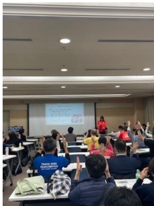
会場中が手話の拍手でいっぱいになりました。

その後の茶話会では、手話ができる方もできない方も、通訳を介しながら和やかに交流しました。仕事との両立や日々の工夫といった身近な質問にも、登壇者の皆さまが笑顔で丁寧に答えてくださり、会場は最後まであたたかな雰囲気包まれていました。デフリンピックが灯した思いや学びを日常の中につなげていく大切さを改めて感じだれもとりのこさない世界の一步をふむ貴重な機会となりました。