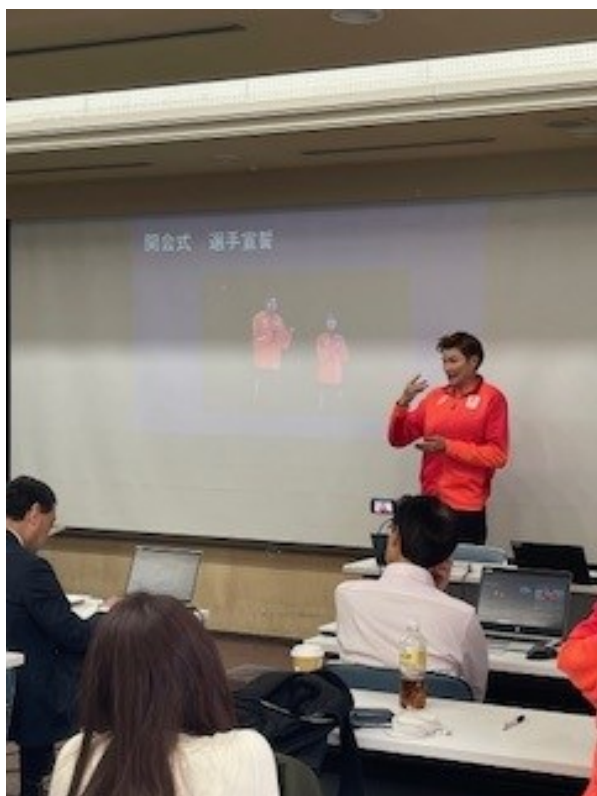
山田真樹選手のお話し

山田真樹選手は、男子陸上 400m、4×400m リレーで金メダル、200m で銀メダルという素晴らしい成績を収められました。一時は「走れないかもしれない」と悩んだ時期もあったそうですが、周囲の支えによって乗り越えることができたと言われました。また、日本開催ならではの応援については、「プレッシャーでもあり、最大の励みにもなった」と話されていました。